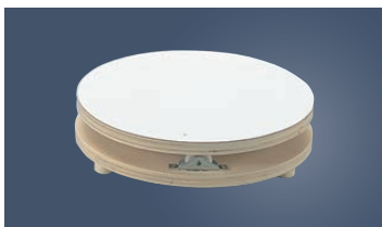
⑦ 木製 白デコラ 回転台