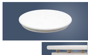
⑪ 人工大理石 回転台

外寸:φ310×H140 材質:本体/ABS樹脂、Uピン/18-8ステンレス ●ケーキ側面のデコレーションがきれいにできます。 ●スタンド式なのでケーキを置く位置が高く、デコレーションしやすいです。