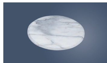
③ 大理石 回転台