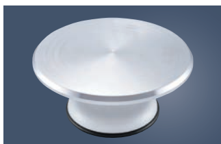
① アルミ鋳物 デコ回転台 4157