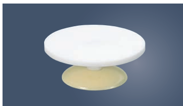
④ ジュラコン 回転台