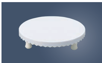
⑥ PC デコレーション 回転台 小