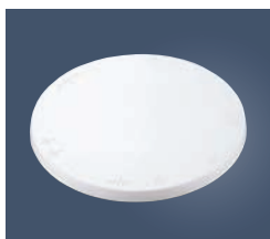
⑨ PC トラクタ クールスタンド (回転台)