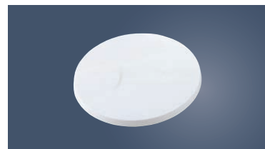
⑧ PC クールスタンド (回転台)