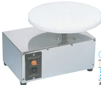
⑤ 電動 ジュラコン 回転台